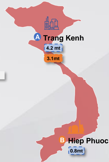
Aset Internasional — Chinfon Vietnam